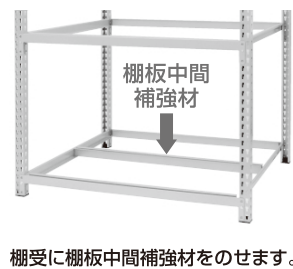
棚受に棚板中間補強材をのせます。

4のロックピンを差し込む所までは、同じ組立です。次に棚受に棚板中間補強材をのせ、棚板を入れて下さい。