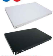
コンビ棚板 30 カマチ 1枚 スチール製 粉体塗装