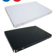
コンビ棚板 35 カマチ 補強付 1枚 スチール製 粉体塗装